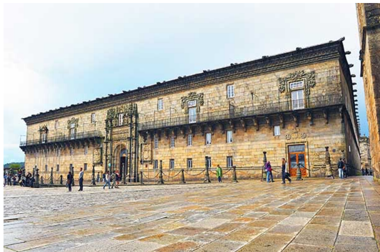
Hostal de los Reyes Católicos

Verder is er vanwege de bedevaart in 1492 een groot hotel gebouwd dat er nog steeds staat: